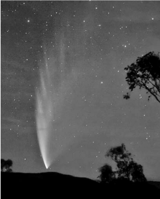
La comète McNaught (C/2006/P1), photographiée le 23 janvier 2007 à Swifts Creek en Australie.