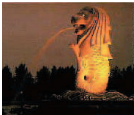
Le Merlion de Singapour

JIM McCULLOGH observait les yeux verts du Merlion qui clignotaient au loin dans la nuit. Le paquebot glissait sans bruit sur les eaux calmes au milieu des fanaux d'embarcations de toutes tailles ancrées dans la rade. Bien que de relâche pour la journée, notre marin s'était levé tôt car il ne voulait manquer sous aucun prétexte le spectacle fascinant qu'était à chaque fois l'arrivée de nuit dans le port de Singapour.