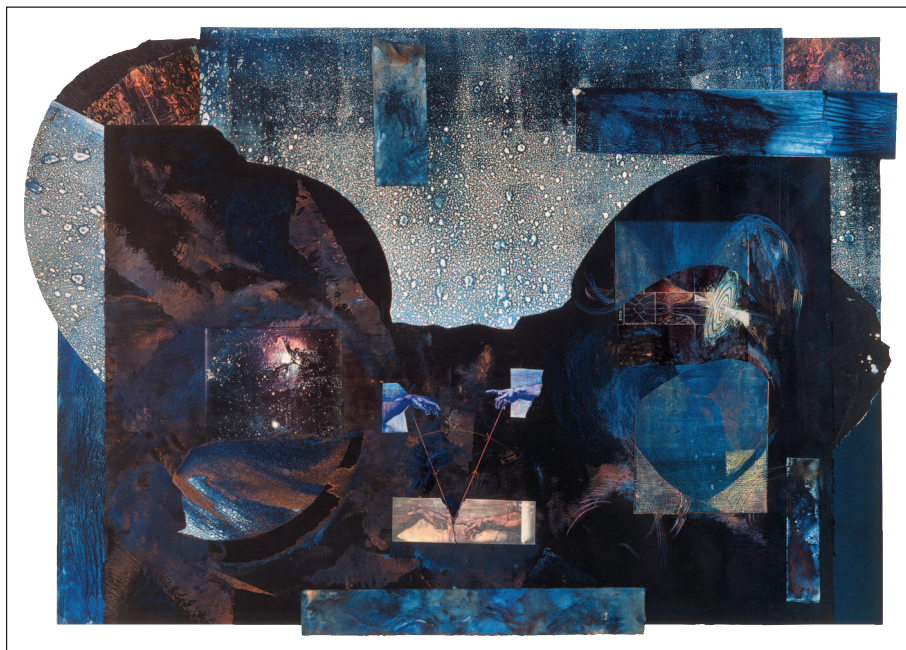
Fig. 1 – Galileo's Eyelid.

Maine, ...) et des endroits prestigieux comme le Center for Advanced Studies de l'Université de Stanford. Elle fut aussi invitée pour des exposés dans un grand nombre de réunions internationales, non seulement en Amérique du Nord, mais aussi en Europe et en Afrique du Sud. Ses thèmes favoris sont les passerelles entre art, science et spiritualité.